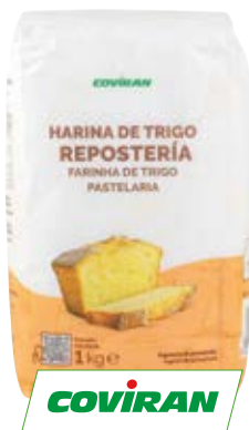
0,79 COVIRAN Harina repostería 1 kg

*Precio Club Familia, máximo 24 unidades por ticket.