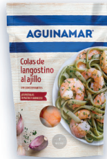
AGUINAMAR® COLAS DE LANGOSTINO AL AJILLO 105 G