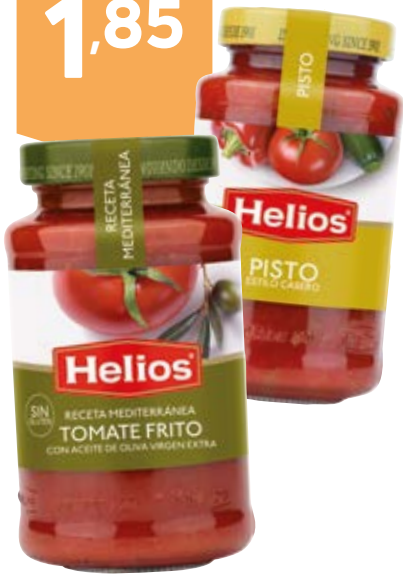
HELIOS Tomate frito aceite oliva o pisto casero 560 g aprox. 3,30 €/kg