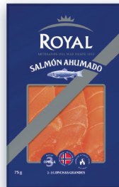
ROYAL® SALMÓN AHUMADO 75 G