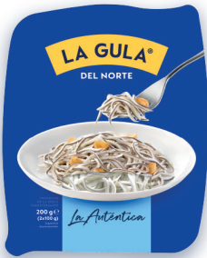
LA GULA® DEL NORTE BANDEJA DE 200 G