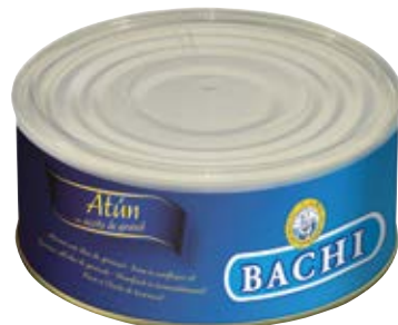
6,99 BACHI Atún aceite vegetal 650 g 10,75 €/kg

*Precio Club Familia, máximo 24 unidades por ticket.