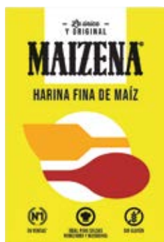
1,75 MAIZENA Harina de maíz 400 g 4,38 €/kg