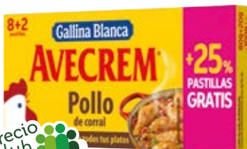
Precio club FAMILIA 0,90 0,09 €/u. 1,00