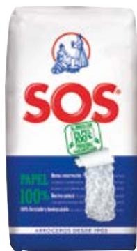
1,87 SOS Arroz 1 kg