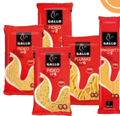
0,65 GALLO Pastas fideo 0, fideo 2, fideo 4, plumas nº6 o spaghetti 3 - 250 g 2,60 €/kg