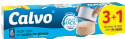
2,95 CALVO Atún claro aceite girasol 52 g pack 3 + 1 u. 14,18 €/kg